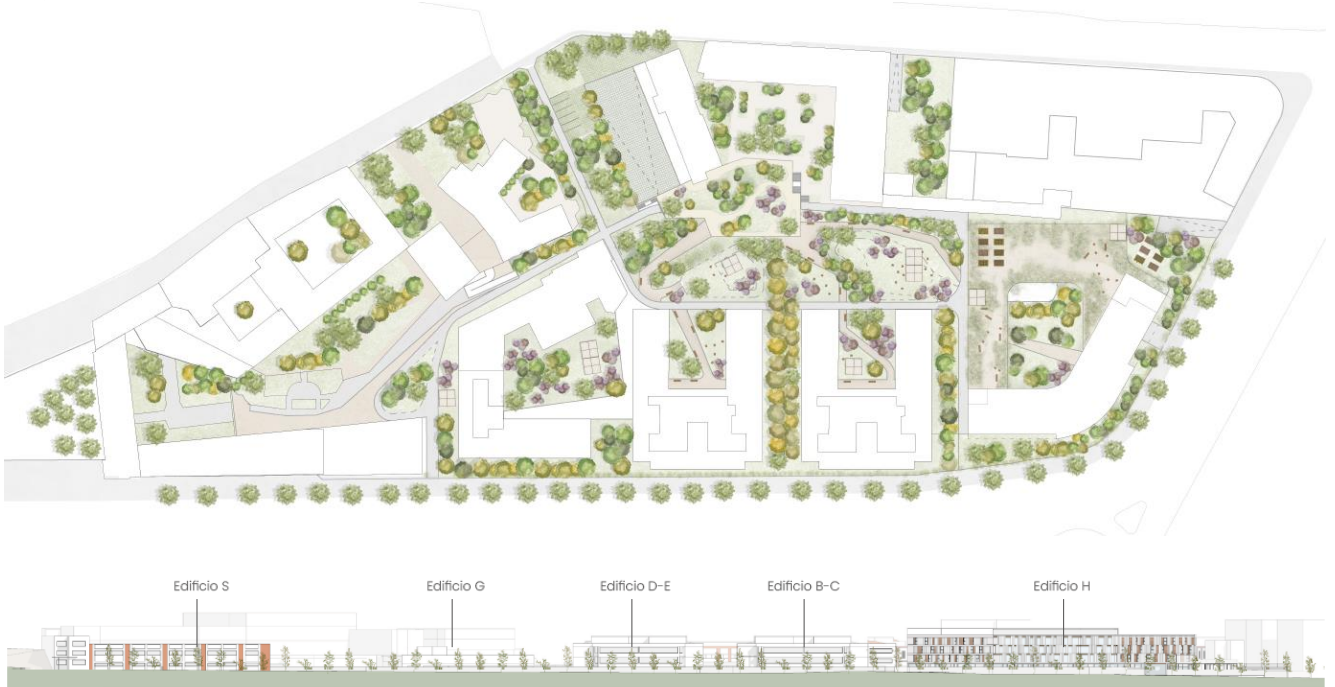
Nou alçat a la ciutat des del carrer Pablo Picasso